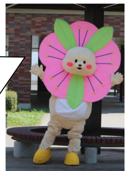
学校公式マスコットキャラクター「みなみちゃん」